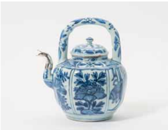
65 Een gebombeerde blauw-witte wijnkan met deksel Wanli

Met opgaand hengsel en een decor van perken met kostbaarheden, bloemen en een vlinder. De tuit met zilveren montuur.