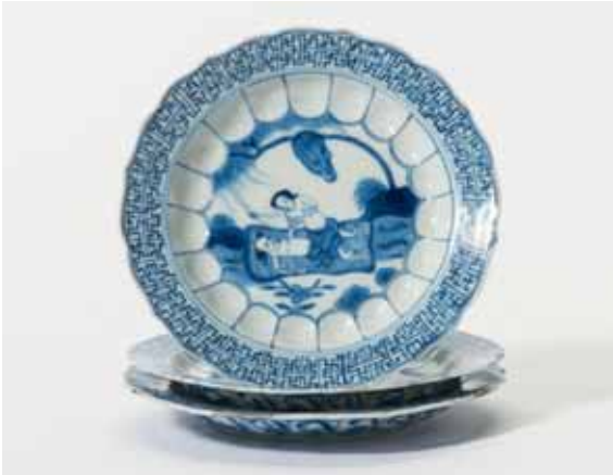
63 Een serie van drie gebombeerde blauw-witte schoteltjes Kangxi

Met een centraal decor genaamd 'De Acupuncturist'.