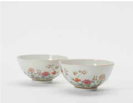
90 Een paar 'famille-rose' kommen