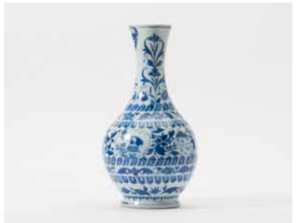
66 Een bolvormige blauw-witte kan met lange hals Chongzhen

Op de romp vier medaillons gescheiden door ranken, rond de hals twee tulpen. Met tuit.