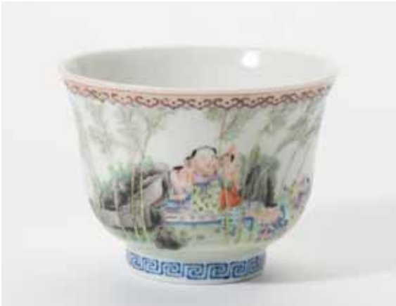
88 Een kommetje met spreidende rand