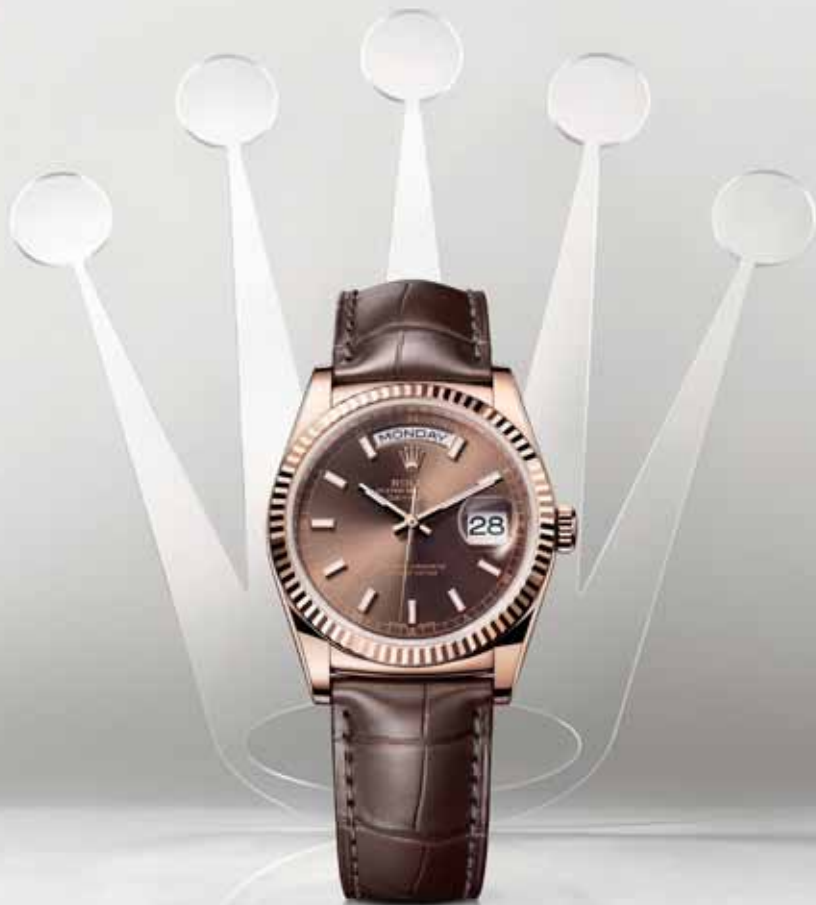
OYSTER PERPETUAL DAY-DATE 36

The 'presidents' watch', the first wristwatch to display the day and date in full, has marked the height of prestige and elegance since 1956. It doesn't just tell time. It tells history.