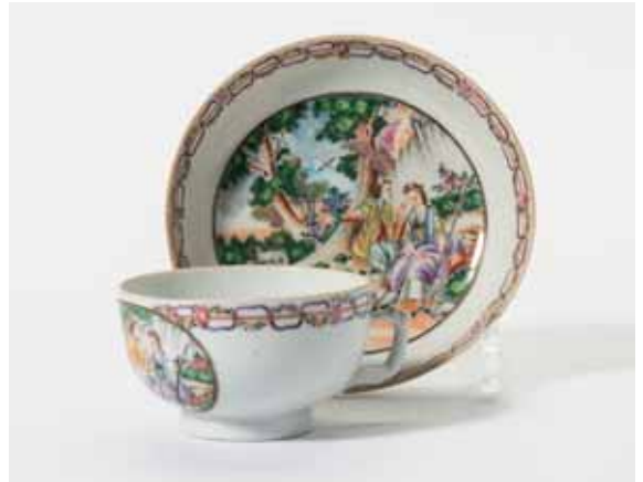
89 Een 'Chine de Commande' theekop en schotel