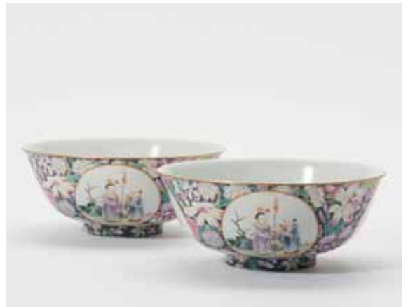
91 Een paar 'famille-rose' kommen