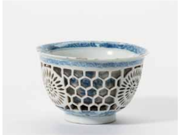
64 Een dubbelwandig opengewerkt blauw-wit kopje Kangxi

De buitenwand met honingraatpatroon en drie rozetten met centrale munt. Rond de voet gestileerde ranken. Gemerkt.